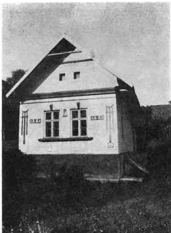
Murovaný dvojdielny dom č. 96 so sedlovou strechou a štukovou výzdobou v priečeli, datovaný do r. 1914. Predstavuje mladšiu formu tradičného kovoroľníckeho obydľia v obci s modernými stavebnými technológiami a tvrdým stavebným materiálom, ale redukovaným pôdorysom. Sliače pri Ružomberku, časť Nižný Sliač, okr. Lipt. Mikuláš. Foto J. Podoba 1985