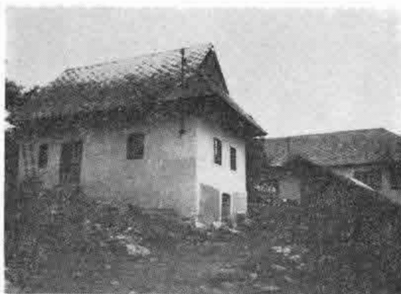
Murovaný dom so sedlovou strechou postavený po 1. svetovej vojne. Predstavuje mladšiu formu tradičného roľníckeho obydlija. Muránska Zdychava, časť Vyšná Zdychava, okr. Rožňava.