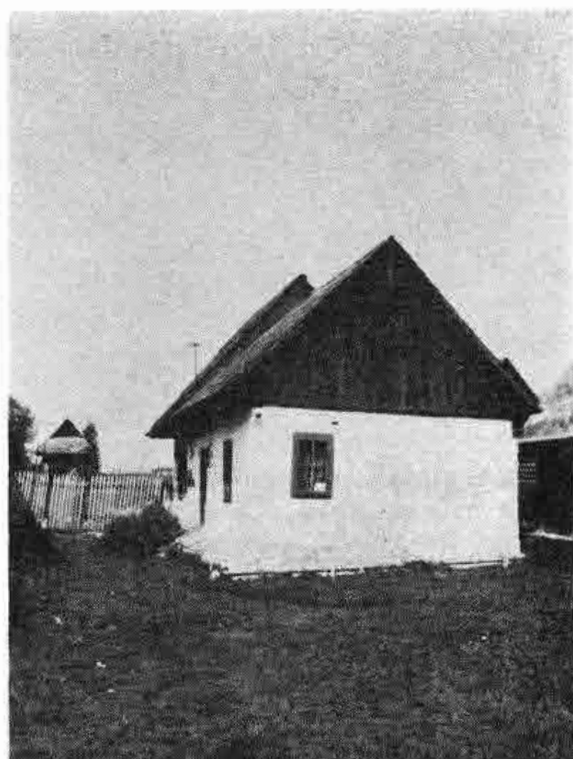
Zrubový trojdielny dom č. 673 so sedlovou strechou z druhého desaťročia 20. storočia. Predstavuje mladú formu tradičného dreveného domu chudobnejších vrstiev. Sliače pri Ružomberku, časť Stredný Sliač, okr. Lipt. Mikuláš.

lémov mladých manželov sústredíme iba na niekoľko základných problémových okruhov: