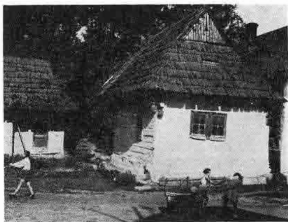
Zrubový dom so sedlovou strechou. Predstavuje tradičné roľnícke obydlie v obci. Sliache pri Ružomberku, časť Nižný Sliach, okr. Lipt. Mikuláš. Foto J. Podolák 1962