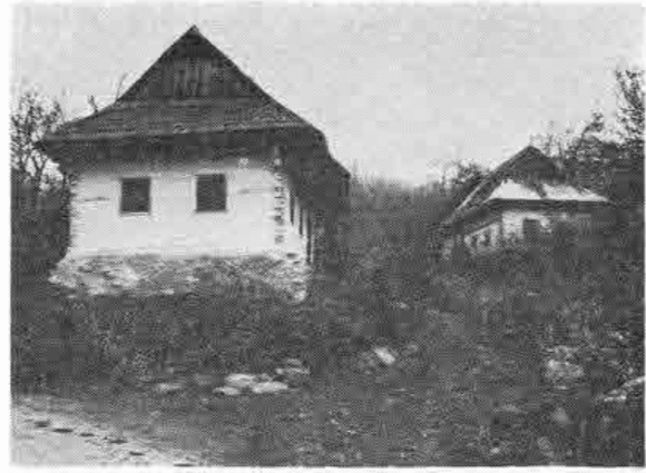
Typický urbanistický celok, tvorený tradičnými dvojdielnymi zrubovými roľníckymi domami z druhej polovice 19. storočia. Muránska Zdychava, časť Vyšná Zdychava, okr. Rožňava.

chodného Slovenska, kde ženích s nevestou trávili svadobnú noc obvykle na pôjde. 10