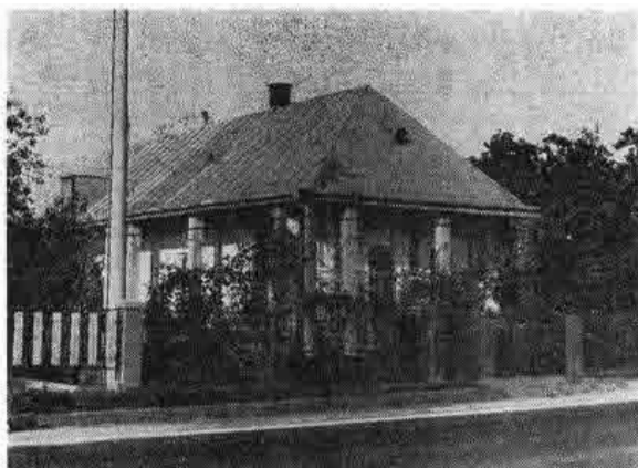
Murovaný trojdielny dom s valbovou strechou, krytým stĺpovým podstelením a štukovou výzdobou na priečeli. Predstavuje mladšiu formu tradičných roľníckych obydlí v obci, postavených po 1. svetovej vojne. Veľké Zalužice, okr. Michalovce. Foto J. Paličková 1984