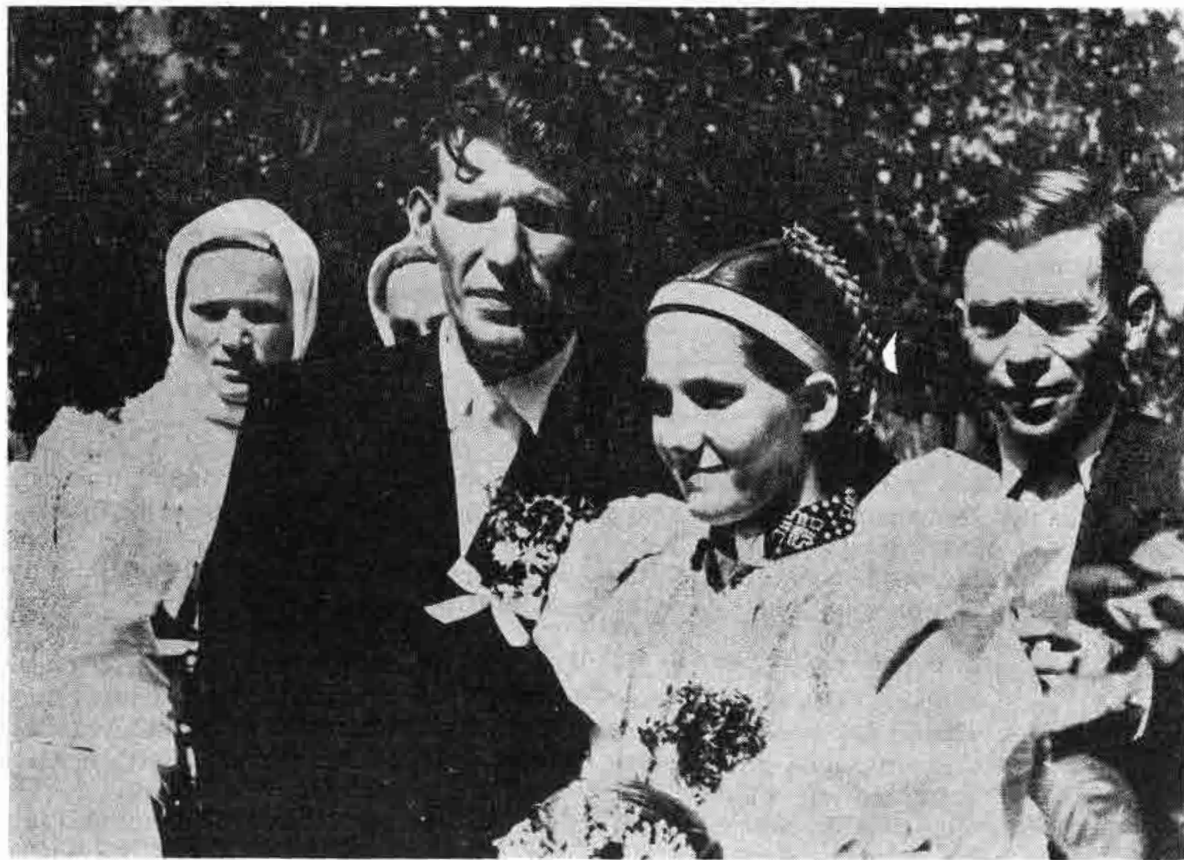
Svadobný pár. Žakarovce, okr. Gelnica. 1953.

3. Die Möglichkeiten des jungen Paares (der jungen Familie) einen separaten Wohnsitz zu erlangen und in dieser Beziehung selbständig zu werden.