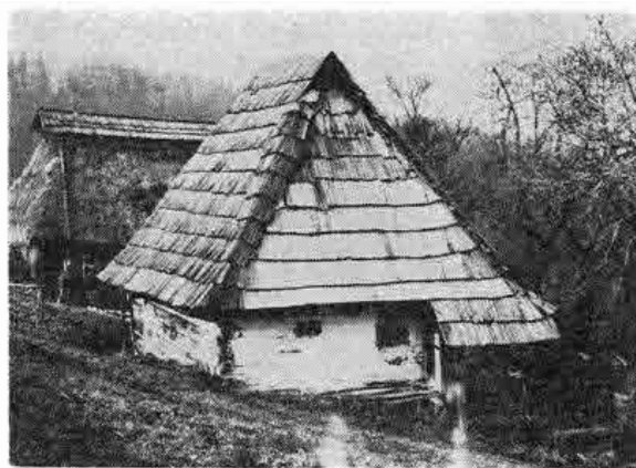
Dvojdielna zrubová chýška s valbovou strechou a bočnou komorou, postavená koncom 19. storočia. Predstavuje pôvodne tradičné sezónne obydlie, ktoré sa v priebehu 20. stor. menilo na trvalé. Chotárne sídlo Paseka, Muránska Zdychava, okr. Rožňava. Foto J. Podoba 1987

Zalužiciach už koncom 19. stor.) začal proces rozpadu rozšírených rodín, zložených z rodičov a z rodín súrodencov. Napriek postupnému presadzovaniu sa oddeleného hospodárenia a v rámci možností i bývania rodičov a rodín dospelých detí sa v Sliachoch a v Muránskej Zdychave ešte v medzivojnovom období udržiavalo spoločné bývanie viacerých rodín ženatých bratov a vo všetkých troch lokalitách až do druhej polovice 20. stor. spoločné bývanie (zriedkavejšie i hospodárenie) rodičov a rodiny jedného syna či dcéry. V 20. stor. sa už mladé rodiny spravidla od rodičov vždy po čase hospodársky separovali. Ale práve v prvých mesiacoch či rokoch spoločného života boli od rodičov závislí. Iba zriedkavo sa mladí osamostatnili hneď po svadbe, niekedy spoločné hospodárenie s rodičmi trvalo i celé desaťročie. Veľmi často s rodičmi bývali v jednom dome či izbe až do ich smrti. 14