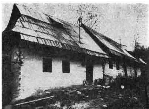
Zrubové dvojdielne domy č. 52, 53 so sedlovou strechou, postavené v druhej polovici 19. stor. Predstavujú tradičný typ roľníckeho obydlia v obci. Muránska Zdychava, časť Vyšná Zdychava, okr. Rožňava. 1987

sa snažila získať vlastný byt. 6 V dôsledku hospodárskej situácie v druhej polovici 19. a na začiatku 20. storočia (v niektorých oblastiach, lokalitách či rodinách až do polovice 20. stor.) sa i po rozpade rozšírenej rodiny jednotlivé malé rodiny často nemohli rezidenčne osamostatniť. I keď prestali spoločne hospodáriť, naďalej obývali spoločný dom. „Spolubývanie príbuzných rodín nebolo výsledkom priania rodín i po rozdelení spoločne obývať jeden dvor, dom či izbu, ale majetkový základ rodičov alebo starých rodičov bol len nutným východiskom pre deľbu majetku medzi potomkov, ktorí nemohli odísť zo svojej otcovizne. Keďže tento majetok sa delil za okolností, ktoré vylúčili samostatnosť rodín a rodiny sa nemohli od seba odsťahovať, sťahovali sa vo chvíli, keď tieto okolnosti prestali platiť, keď hospodárske podmienky rodín vytvorili v závislosti na diferenciačnom procese nové predpoklady pre ich rezidenčné osamostatnenie sa.“ 7 Ak sa však ani po rozdelení majetku nemohli z otcovského domu rozísť, v takýchto spoločných domácnostiach sa stretávajú