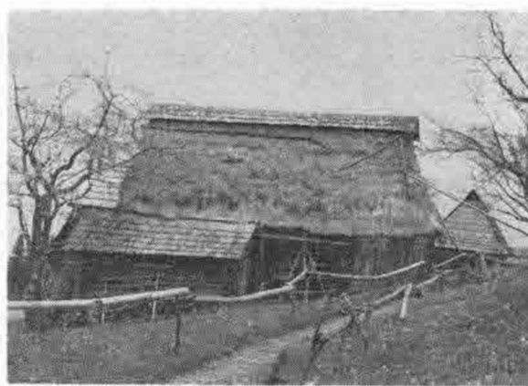
Stodola a chyška z konca 19. stor. v chotári obce. Predstavuje archaickú tradičnú formu sezónnych hospodárskych a obytných stavieb. Chotárne sídlo Paseka, Muránska Zdychava, okr. Rožňava. 1988

kde sa často zdržiavali i cez deň. V ostatných dvoch lokalitách, i keď spali ako ostatní členovia rodiny v dome, v prípade väčšieho počtu rodinných príslušníkov sa im ušlo iba podradnejšie miesto na spanie (lavica, priča, slamník na zemi a pod.). Dievčatá zriedkavejšie spávali mimo domu, vo Veľkých Zalužiciach to nebývalo zvykom. V niektorých rodinách v staršom období (približne do I. svetovej vojny) spávali v tejto lokalite dievčatá (niekedy spolu so starými rodičmi) v komore. Vstupom do manželstva sa postavenie mladého páru podstatne zmenilo.